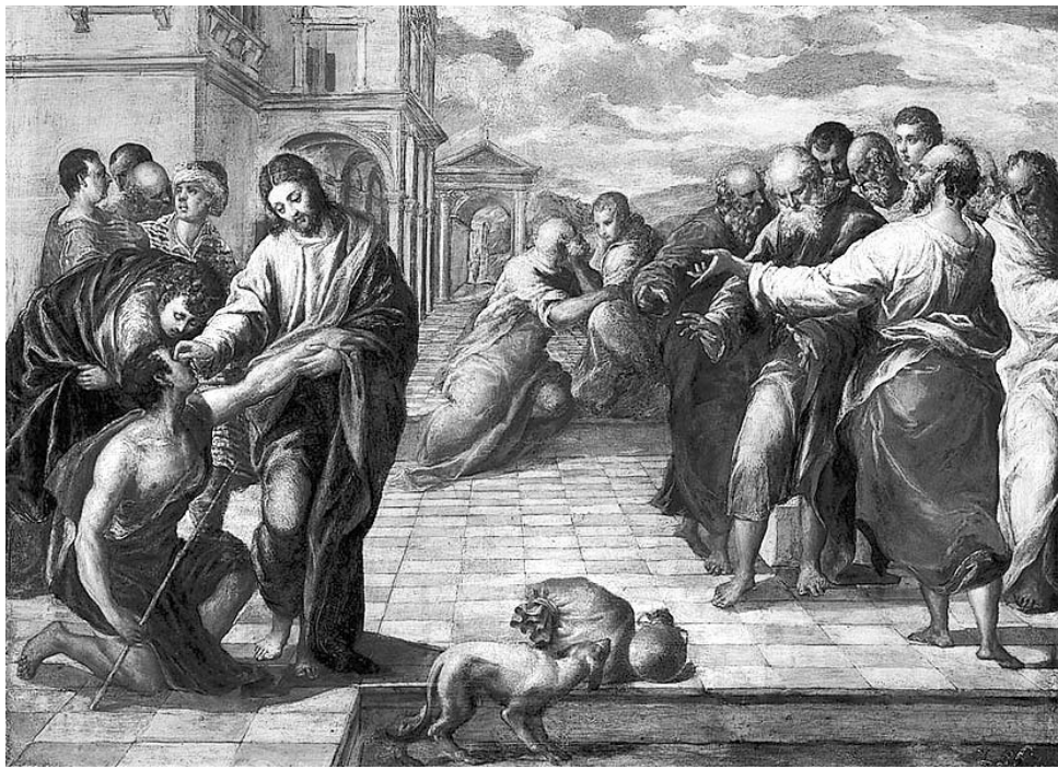
Эль Греко. «Христос исцеляет слепого».

В один из воскресных дней совпали два чтения из Священного Писания: евангельское – об исцелении слепорожденного и апостольское – об аресте святого Павла, с которого начался его мученический путь.